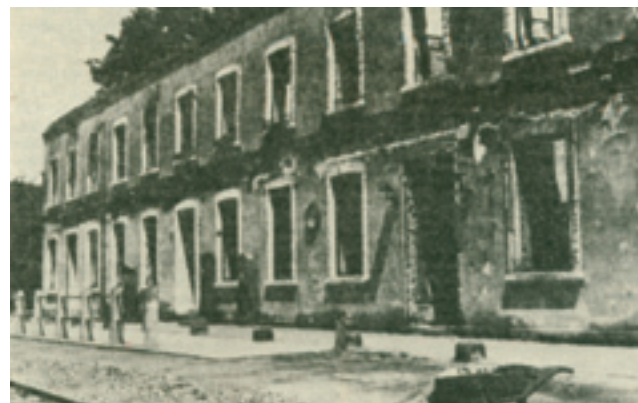
Železničná stanica, vypálená v januári 1945.