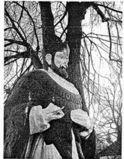
...takto vyzerá náš sv. Ján - Nepomúcky