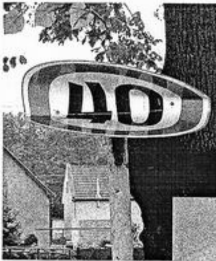
Aj takto vyzerajú dopravné značky v našej obci.

Sme teda naozaj kultúrne a mravne slabí ľudia? Áno, sme. Naša obec a okolie je toho dôkazom. Tieto fotografie hovoria za všetko: