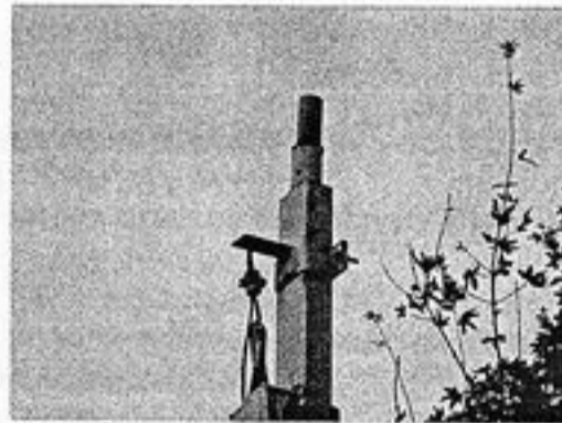
Aj takto vyzerajú lampy v našej obci