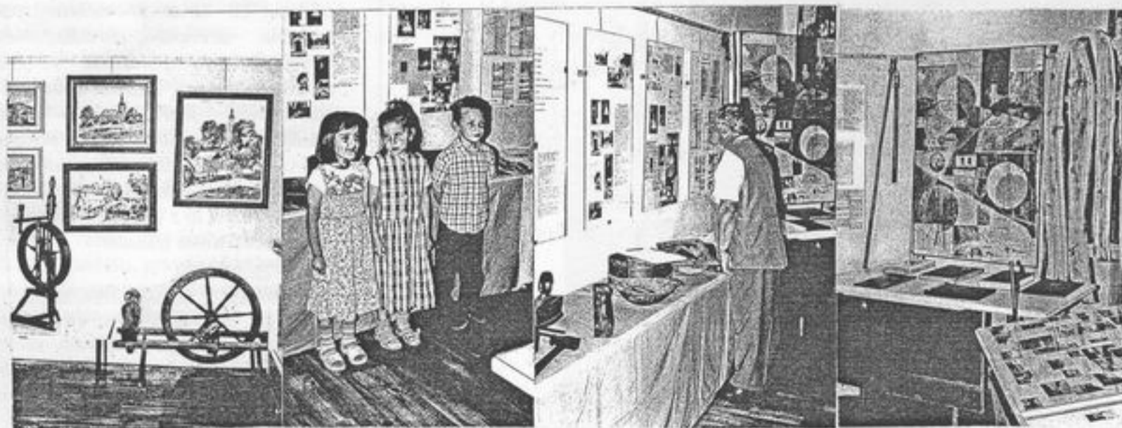
Zábery z výstavy História a život v obci Kostolany n. Hor. 22. 6. 2005