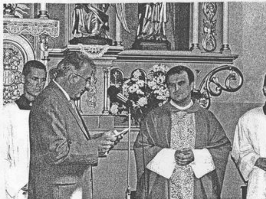
Z privítania nového správcu farnosti nedeľa 3.júla 2005